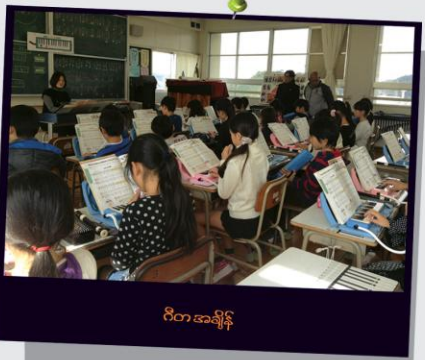
ဝိတ အချိန်

စေတနာ အဖွဲ့အကြောင်းအသေးစိတ်သိရှိလိုပါက www.saetanar.org သို့ ဝင်ရောက်ကြည့်ရှုနိုင်ပါသည်။ အကြံပြုချက်များ စာမူများကို လည်း နီးစပ်ရာစေတနာရှင်များသို့ ပေးပို့နိုင်ပါသည်။