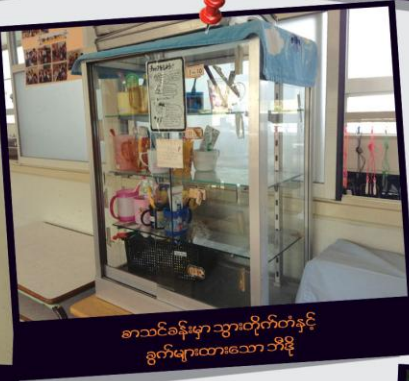
စာသင်ခန်းမှာ သွားတိုက်ခံနှင့် ခွက်များထားသော ဘီဇို