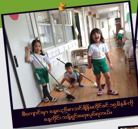
ခွဲကျောင်းမှာ နေ့လည်စာသင်ချိန်မတိုင်ခင် ၁၅ မိနစ်ကို နေ့တိုင်း သန့်ရှင်းရေးလုပ်ရတယ်။

၂၀၁၃ခုနှစ် နိုဝင်ဘာလ ၂၂ရက်နေ့တွင် ကာဂိုရီးမားမြို့ရှိ မကြိုင်ကြိုင်ပညာသင်ကြားခဲ့သော Municipal Somuta Elementary School မြို့နယ်အခြေခံပညာမူလတန်းကျောင်းသို့ လေ့လာရေးသွားရောက်ခဲ့ပါသည်။ လေ့လာရေး ခရီးစဉ်တွင် ကျောင်းတွင်း သင်ကြားရေးအထောက်အကူပြုပစ္စည်း များနှင့်စာသင်ခန်းတွင်း စာသင်ကြားနေမှု များကိုကြည့်ရှုလေ့လာခဲ့ကြသည်။ ထိုအပြင်ကျောင်း တာဝန် ရှိသူများဖြင့် ကျောင်းလုပ်ငန်းဆိုင်ရာစီမံခန့်ခွဲမှုများ၊ ဂျပန်နိုင်ငံ ပညာရေးစနစ်၊ ဆရာဆရာမများကို ဖွမ်းမံသင်ကြားပေးပုံ စသည့် ပညာရေးနှင့်သက်ဆိုင်သောစိတ်ဝင်စားဖွယ်အကြောင်းအရာများကို မေးမြန်းဆွေးနွေးခဲ့ကြပြီး နောက်ဆုံးအနေဖြင့်ကျောင်းသား ကလေးများနှင့်အတူယဉ်ကျေးမှုဖလှယ်ရေးလုပ်ငန်းများကို ဆောင်ရွက် ခဲ့ကြပါသည်။