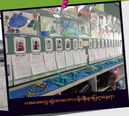
ကလေးတွေ ဆွဲထားသော ပန်းချီများပြရာနေရာ