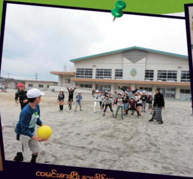
ထမင်းစားပြီး နားချိန်မှာ ကလေးတွေ ကစားနေသောပုံ