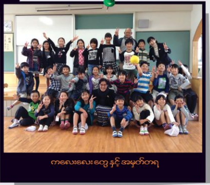
ကလေးလေး တွေ နှင့် အမှတ်တရ