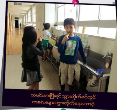
ထမင်းစားပြီးရင် သွားတိုက်ခင်တွင် ကလေးများ သွားတိုက်နေသောပုံ