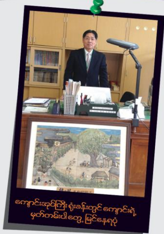
ကျောင်းအုပ်ကြီး ရုံးခန်းတွင် ကျောင်းရဲ့ မှတ်တမ်းပါတွေ မြင်နေရပုံ