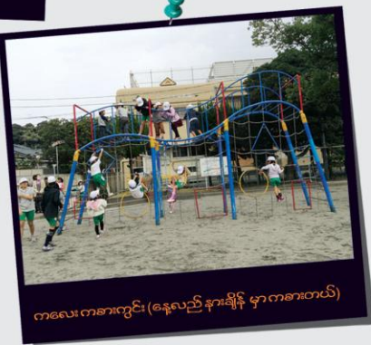
ကလေး ကစားကွင်း (နေ့လည် နားချိန် မှာ ကစားတယ်)