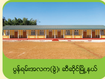
ပွန်ရမ်းအလက(ခွဲ)၊ ဆီဆိုင်မြို့နယ်