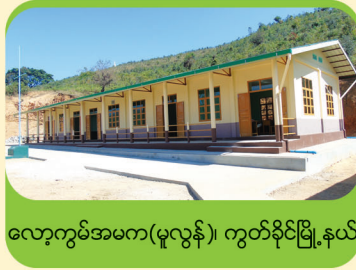
လော့ကွမ်အမက(မူလွန်)၊ ကွတ်ခိုင်မြို့နယ်