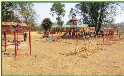
နားလော့အမက၊ သီပေါမြို့နယ်