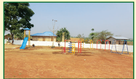
ဖီးဖြူပင်အမက(မူလွန်)၊ နောင်ချိုမြို့နယ်