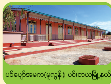
ပင်ပျော်အမက(မူလွန်)၊ ပင်းတယ်မြို့နယ်