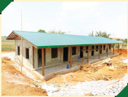
ခိုမုန်းအမက၊ ကျောက်မဲမြို့နယ်

ရှမ်းပြည်နယ်မြောက်ပိုင်းတွင် ဆရာ/ဆရာမနေအိမ်ဆောက်လုပ်ပေးရန် ကျောက်မဲမြို့နယ်ရှိ ခိုမုန်း အမက နှင့် ပန်ကွမ် အလကကျောင်းများကို ရွေးချယ်ခဲ့ပါသည်။ ထိုကျောင်းများတွင် (၇၂x၂၄) ပေ ဆရာ/ဆရာမနေအိမ်ဆောင်ကို ဆောက်လုပ်ပေးလျက် ရှိပါသည်။ ၂၀၁၉ ဧပြီလအတွင်း ဆရာ/ဆရာမနေအိမ်ဆောင်ဆောက်လုပ်နေဆဲအခြေအနေများကို ဖော်ပြထားပါသည်။ ရှမ်းပြည်နယ်တောင်ပိုင်းတွင်လည်း ဟိုပုံးမြို့နယ်ရှိ ဟိုဟွေးအလက(ခွဲ) နှင့် နမ့်ဆန်မြို့နယ်ရှိ (၈) မိုင် အမကကျောင်းများတွင် ဆရာမနေအိမ်ဆောင်လုပ်ပေးရန်အတွက် ရွေးချယ်ထားပါသည်။