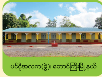
ပင်ငိုအလက(ခွဲ)၊ တောင်ကြီးမြို့နယ်