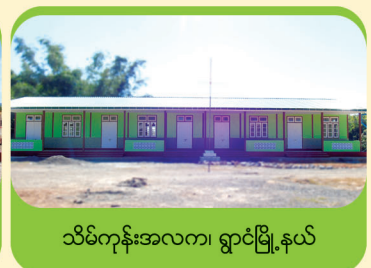
သိမ်ကုန်းအလက၊ ရွာငံမြို့နယ်