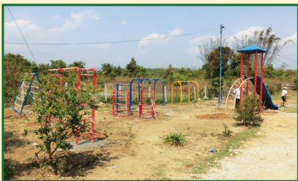
မောက်စလီအမက၊ သိန်းနီမြို့နယ်

၂၀၁၈-စီမံကိန်းနှစ်အတွက် စေတနာအဖွဲ့မှ ရှမ်းပြည်နယ်တောင်ပိုင်းရှိ (၁၀) ကျောင်း၊ ရှမ်းပြည်နယ်မြောက်ပိုင်းရှိ (၄) ကျောင်း နှင့် ကယားပြည်နယ်ရှိ (၂) ကျောင်းတွင် ကလေးကစားကွင်းပစ္စည်းများတပ်ဆင်ပေးရန် ရွေးချယ်ခဲ့ပြီး စီမံကိန်းကို အကောင်အထည်ဖော်ဆောင်ရွက်လျက် ရှိပါသည်။