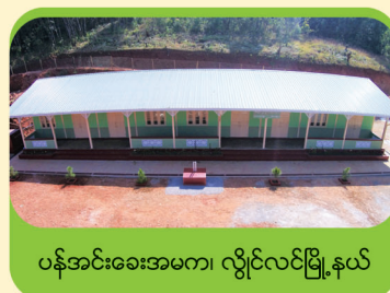
ပန်အင်းခေးအမက၊ လွိုင်လင်မြို့နယ်