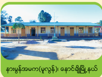
နားမွန်အမက(မူလွန်)၊ နောင်ချိုမြို့နယ်