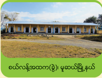
ဝယ်လန်အထက(ခွဲ)၊ မူဆယ်မြို့နယ်