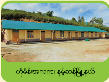
ဟိုမိန်းအလက၊ နမ့်ဆန်မြို့နယ်