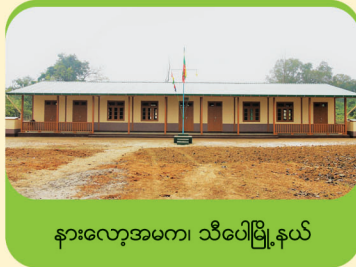
နားလော့အမက၊ သီပေါမြို့နယ်