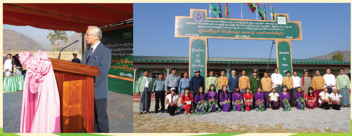
ငွေတောင်အထက(ခွဲ)