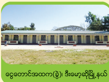
ငွေတောင်အထက(ခွဲ)၊ ဒီးမော့ဆိုမြို့နယ်