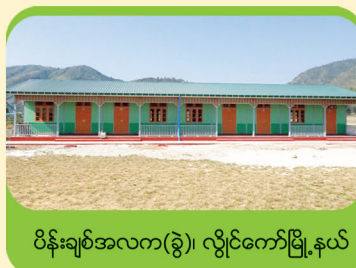
ပိန်းချစ်အလက(ခွဲ)၊ လွိုင်ကော်မြို့နယ်