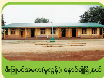
ဇီးဖြူပင်အမက(မူလွန်)၊ နောင်ချိုမြို့နယ်