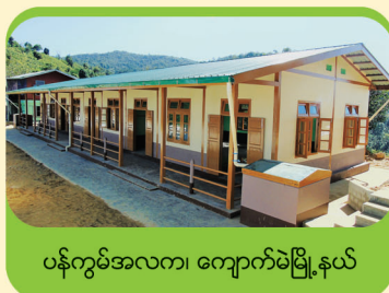
ပန်ကွမ်အလက၊ ကျောက်မဲမြို့နယ်