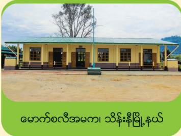
မောက်ဝလီအမက၊ သိန်းနီမြို့နယ်