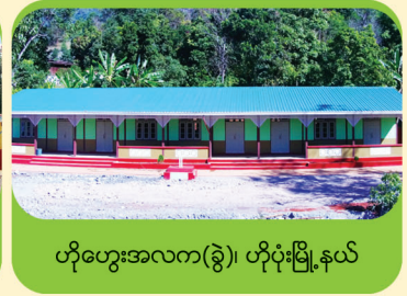
ဟိုဟွေးအလက(ခွဲ)၊ ဟိုပုံးမြို့နယ်