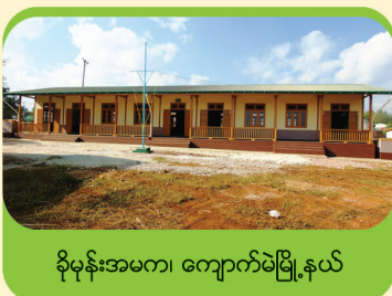
ခိုမုန်းအမက၊ ကျောက်မဲမြို့နယ်