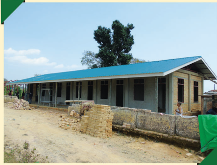
ပန်ကွမ်အလက၊ ကျောက်မဲမြို့နယ်