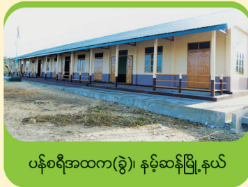
ပန်စရီအထက(ခွဲ)၊ နမ့်ဆန်မြို့နယ်