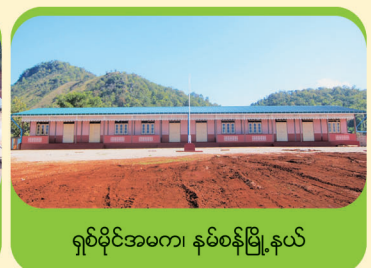
ရှစ်ပိုင်အမက၊ နမ်စန်မြို့နယ်