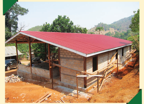
ဟိုဟွေးအလက(ခွဲ)၊ ဟိုပုံးမြို့နယ်