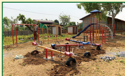
ပိန်းချစ်အလက(ခွဲ)၊ လွိုင်ကော်မြို့နယ်