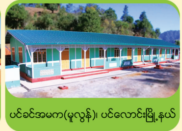
ပင်ခင်အမက(မူလွန်)၊ ပင်လောင်းမြို့နယ်