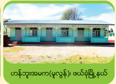
ဟန်ဘူးအမက(မူလွန်)၊ ဖယ်ခုံမြို့နယ်