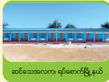
ဆင်သေအလက၊ ရပ်စောက်မြို့နယ်