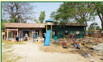
အမှတ်-၂ ငွေတောင်အထက(ခွဲ)၊ ဒီးမော့ဆိုမြို့နယ်